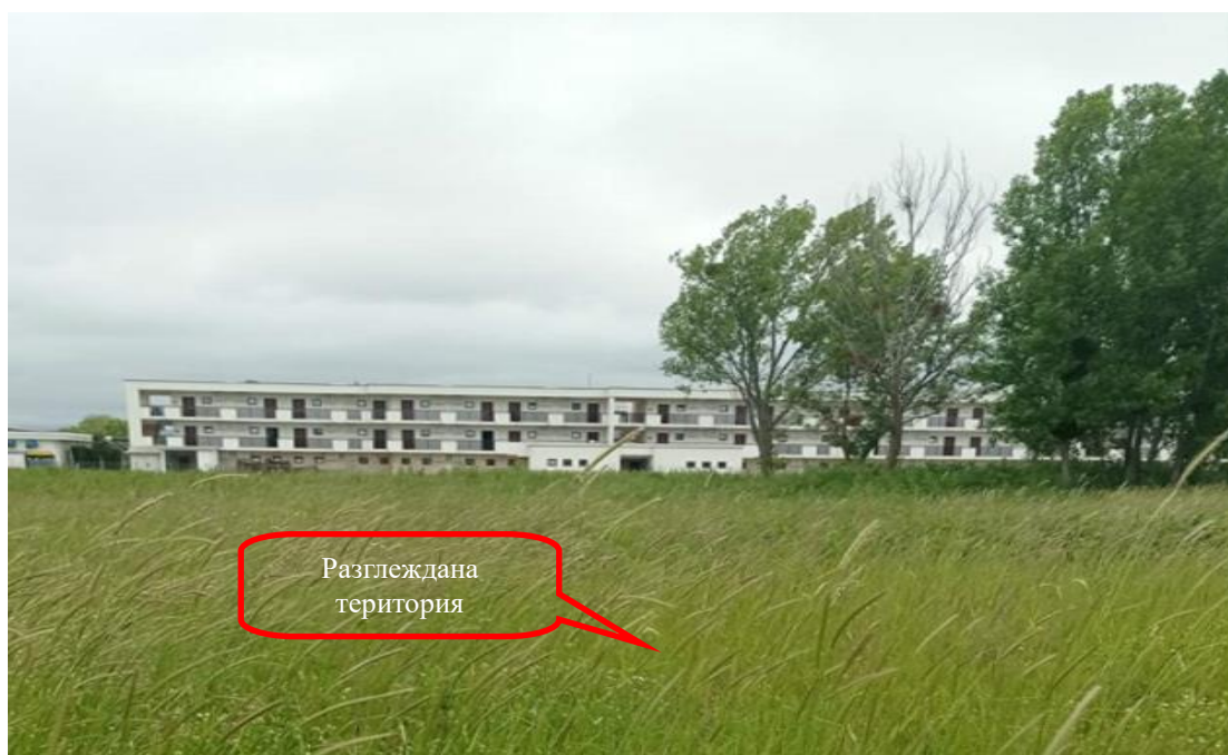
Снимка 1-08: Изглед от север към юг