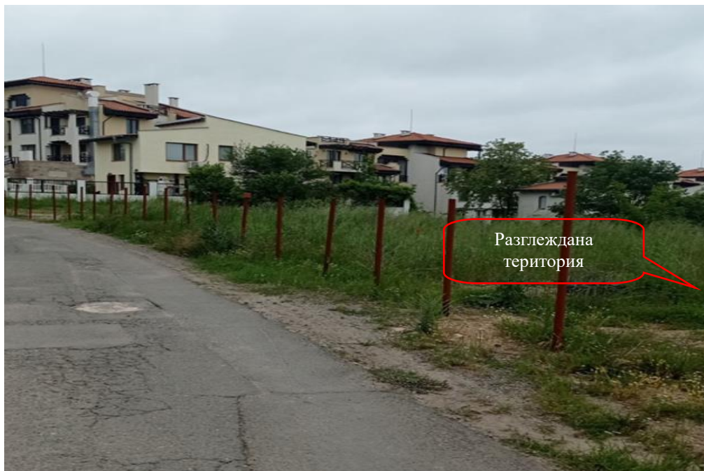
Снимка 1-03: Изглед от съществуващ път от север

Доклад за ОСВ на инвестиционно предложение „Изграждане на сгради за жилищни, курортни и допълващи дейности, нова улична регулация в поземлени имоти с идентификатори 81178.8.62, 81178.8.64, 81178.8.34, 81178.8.88, 81178.8.100, 81178.8.2, 81178.8.4, 81178.8.93, 81178.8.95, 81178.8.162, 81178.6.95, 81178.6.96, 81178.6.99, 81178.6.100, 81178.8.12, 81178.8.104, 81178.8.24, 81178.8.110, 81178.8.311, 81178.8.313, 81178.8.315, 81178.8.317, 81178.8.175, 81178.8.173, 81178.8.165, 81178.8.179, 81178.8.192, 81178.8.191 и обособяване на имоти за природна защита в поземлени имоти с идентификатори 81178.8.312, 81178.8.314, 81178.8.316, 81178.8.318 по КKKP на гр. Черноморец, Община Созопол“