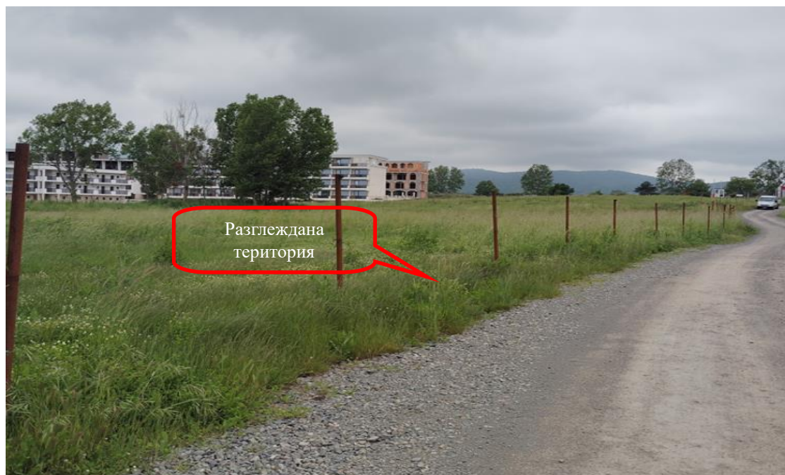
Снимка 1-09: Изглед от изток към запад

Доклад за ОСВ на инвестиционно предложение „Изграждане на сгради за жилищни, курортни и допълващи дейности, нова уллична регулация в поземлени имоти с идентификатори 81178.8.62, 81178.8.64, 81178.8.34, 81178.8.88, 81178.8.100, 81178.8.2, 81178.8.4, 81178.8.93, 81178.8.95, 81178.8.162, 81178.6.95, 81178.6.96, 81178.6.99, 81178.6.100, 81178.8.12, 81178.8.104, 81178.8.24, 81178.8.110, 81178.8.311, 81178.8.313, 81178.8.315, 81178.8.317, 81178.8.175, 81178.8.173, 81178.8.165, 81178.8.179, 81178.8.192, 81178.8.191 и обособяване на имоти за природна защита в поземлени имоти с идентификатори 81178.8.312, 81178.8.314, 81178.8.316, 81178.8.318 по КККР на гр. Черноморец, Община Созопол“