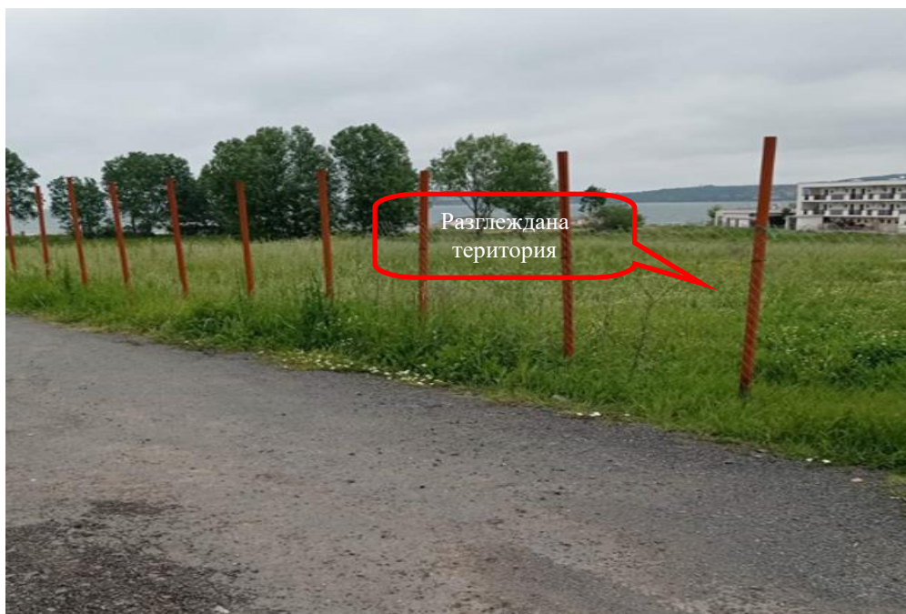
Снимка 1-07: Изглед от съществуващ път от юг

Доклад за ОСВ на инвестиционно предложение „Изграждане на сгради за жилищни, курортни и допълващи дейности, нова улична регулация в поземлени имоти с идентификатори 81178.8.62, 81178.8.64, 81178.8.34, 81178.8.88, 81178.8.100, 81178.8.2, 81178.8.4, 81178.8.93, 81178.8.95, 81178.8.162, 81178.6.95, 81178.6.96, 81178.6.99, 81178.6.100, 81178.8.12, 81178.8.104, 81178.8.24, 81178.8.110, 81178.8.311, 81178.8.313, 81178.8.315, 81178.8.317, 81178.8.175, 81178.8.173, 81178.8.165, 81178.8.179, 81178.8.192, 81178.8.191 и обособяване на имоти за природна защита в поземлени имоти с идентификатори 81178.8.312, 81178.8.314, 81178.8.316, 81178.8.318 по КККР на гр. Черноморец, Община Созопол“