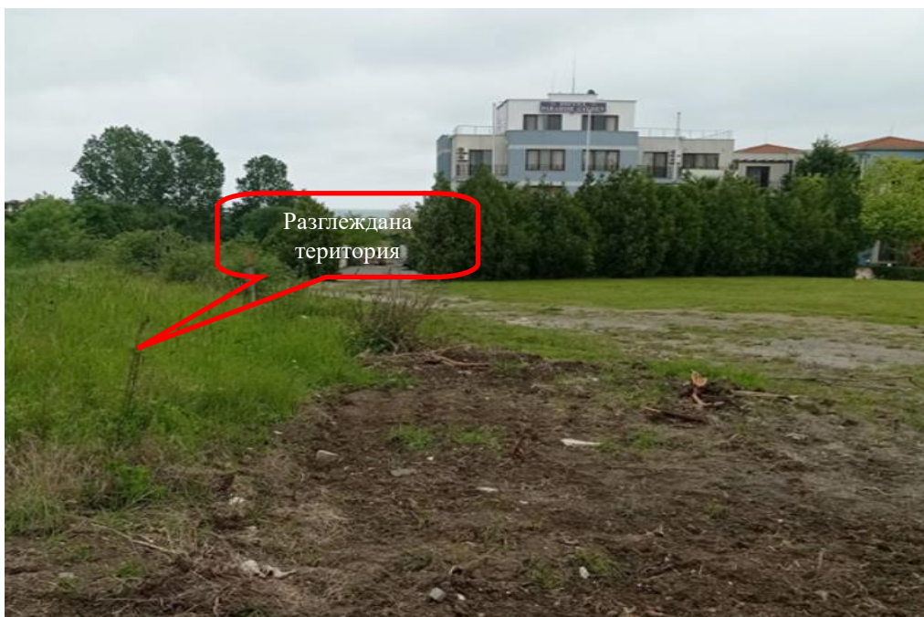
Снимка 1-04: Изглед от запад към изток