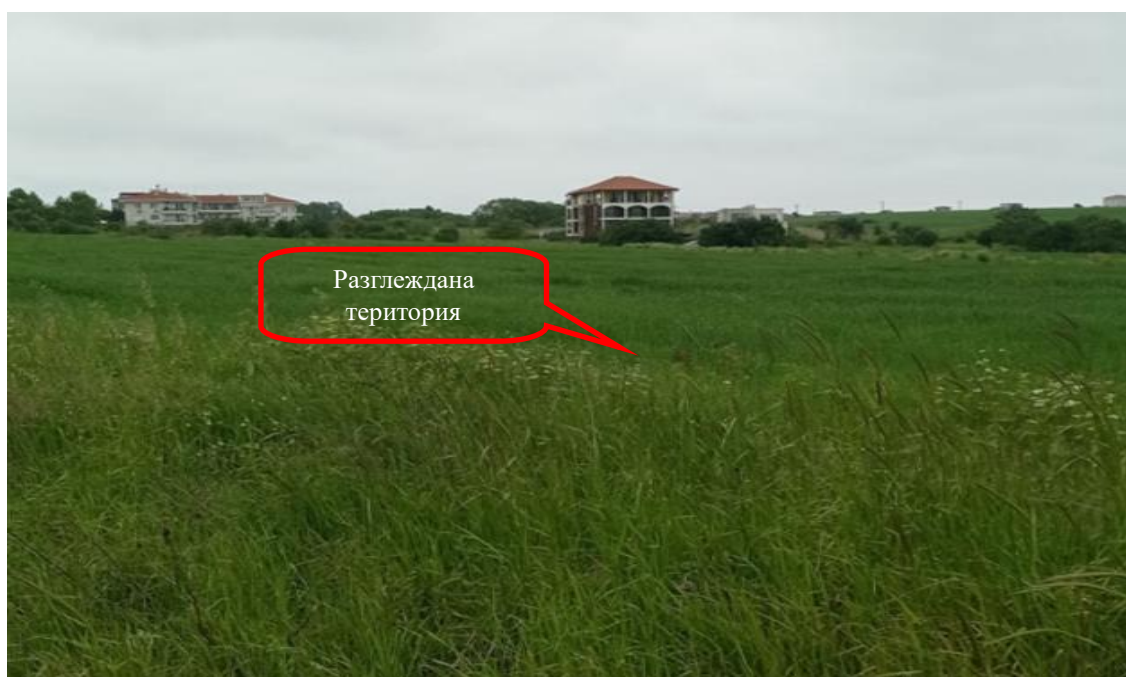
Снимка 1-06: Изглед от юг към север