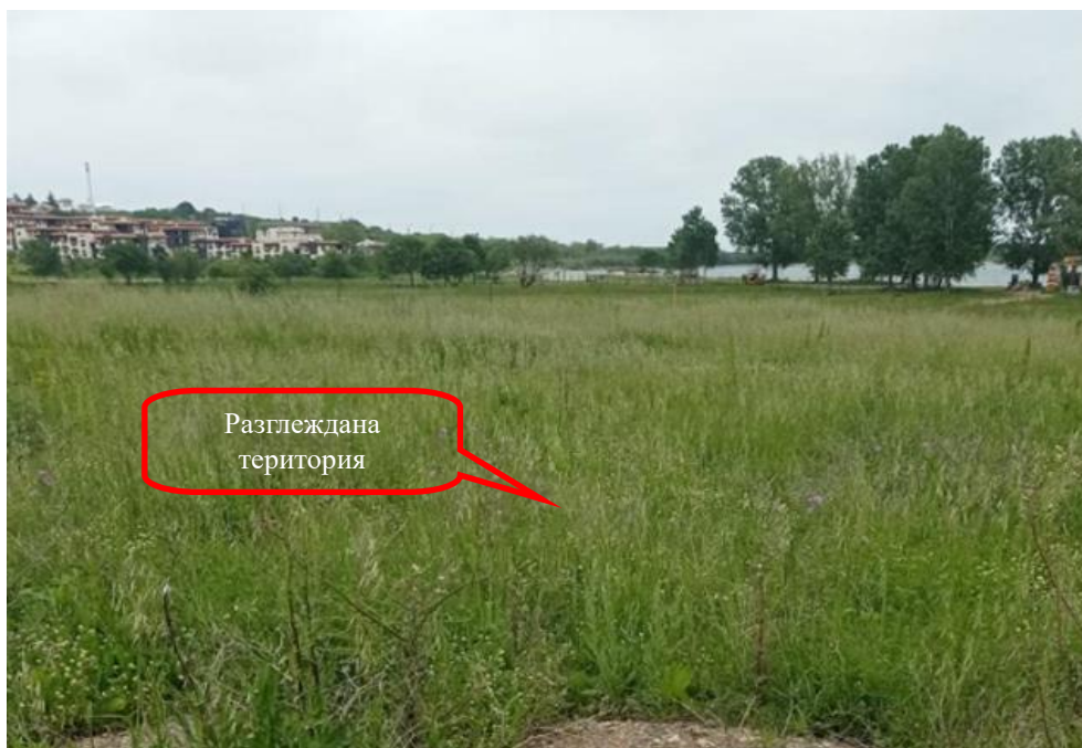
Снимка 1-05: Изглед от юг към североизток

Доклад за ОСВ на инвестиционно предложение „Изграждане на сгради за жилищни, курортни и допълващи дейности, нова улична регулация в поземлени имоти с идентификатори 81178.8.62, 81178.8.64, 81178.8.34, 81178.8.88, 81178.8.100, 81178.8.2, 81178.8.4, 81178.8.93, 81178.8.95, 81178.8.162, 81178.6.95, 81178.6.96, 81178.6.99, 81178.6.100, 81178.8.12, 81178.8.104, 81178.8.24, 81178.8.110, 81178.8.311, 81178.8.313, 81178.8.315, 81178.8.317, 81178.8.175, 81178.8.173, 81178.8.165, 81178.8.179, 81178.8.192, 81178.8.191 и обособяване на имоти за природна защита в поземлени имоти с идентификатори 81178.8.312, 81178.8.314, 81178.8.316, 81178.8.318 по КККР на гр. Черноморец, Община Созопол“