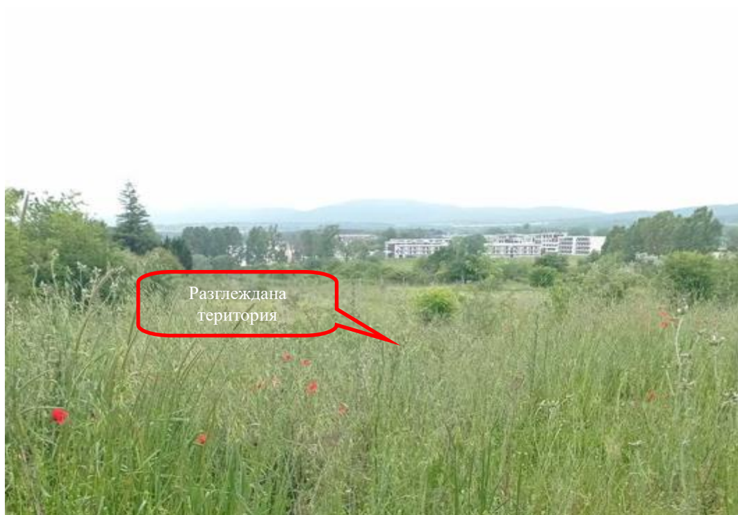
Снимка 1-02: Изглед от север към юг